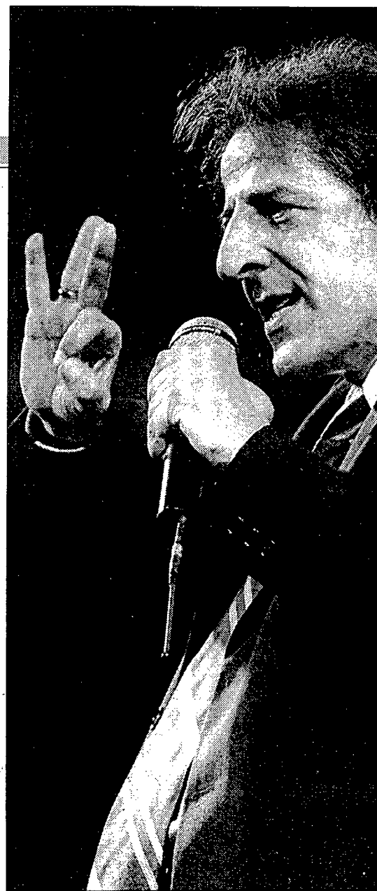
Giorgio Gaber. Ha ricevuto pesanti critiche dal quotidiano del Pds

Gaber non potrà mai essere un uomo di destra, purtroppo per questa destra. Gaber è un uomo di sinistra ma con un peccato originale e poi mortale, di sinistra non della sinistra, la quale, ahilè, non riesce a usarlo, sventolarlo, manipolarlo, gestirlo, metterlo nel circuito preferito per raggruppare consensi (cfr. Mugello e dintorni) non certo idee libere. L'Unità ha scelto il bersaglio comodo, facile. Per loro, Gaber non è televisivo, non è radiosentito, non fa spettacoli per vendere dischi e propagandare libri, non si costanzia per difendersi e tirare su l'ascolto tra un consiglio per gli acquisti e una suonatina dell'orchestra. Per tutti costoro Gaber era. Bello e bravo fino a quando non ti sorprende con le mani nella nu- tella. Per tutti gli altri Gaber sarà. Bello e bravo fin quando continuerà a essere tale. Sta nel bosco o sull'isola, minoranza non protetta da nessun ambientalista, animalista, progressista, illuminista, fascista, sciampista, ista ista. Sta nel bosco e pensa. Sta sull'isola e dice. Beato lui. L'Unità gli ha dedicato quasi un coccodrillo. Visto come se la passa il giornale fondato da Gramsci, sembra autobiografico.